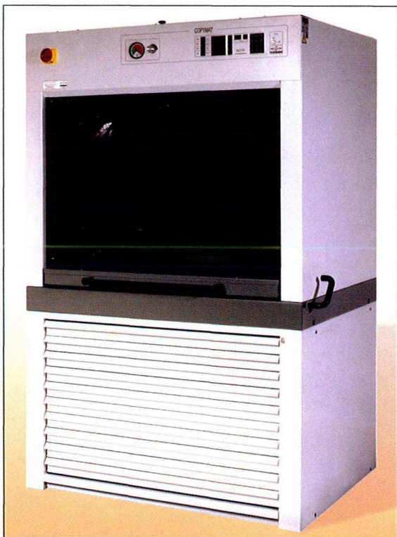
COPYFACE mit Unterschrank

Dieses Kopiergerät ist ausgestattet mit modernster Elektronik, einer zeitgemäßen Kopierlampe und einer stabilen Mechanik.